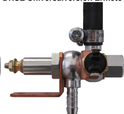
DHSE Universalversion Ermeto

Einbau vor dem Filtereingang in die Kraftstoffleitung PA-/Stahlleitung mit AD 08/10/12mm